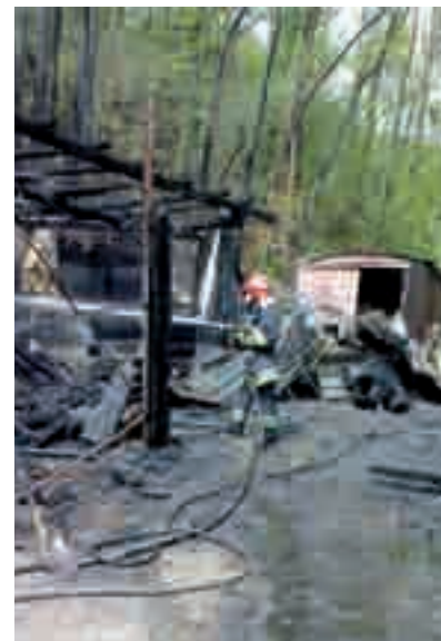
■ Incendio alle Foreste.

In conclusione, possiamo essere soddisfatti del lavoro svolto fino ad ora, ma soprattutto di come lo si è fatto e cioè operando come una squadra unita che lavora all'unisono per fare qualco-