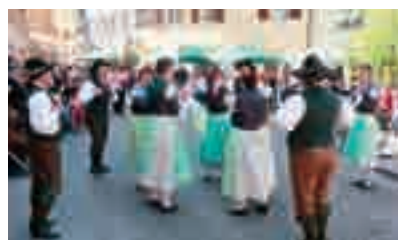
■ Momenti di ballo in Piazza Vecchia.

È stato un lavoro molto impegnativo che ha visto la conclusione nel pomeriggio del 15 febbraio, quando al Palazzetto, gli alunni