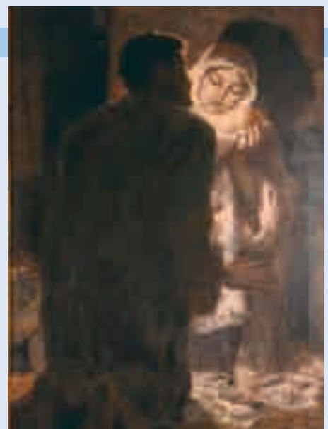
■ Presepio (1898) di Eugenio Prati Collezione Chiesa di Caldonazzo.

Magnifica Corte Trapp, Caldonazzo – ore 21.00