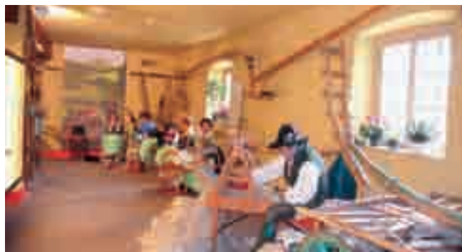
■ Antichi Lavori al Museo degli Usi e Costumi.

S i rincorrono i mesi, ognuno dei quali offre l'occasione di rispolverare qualche antica tradizione del nostro paese.