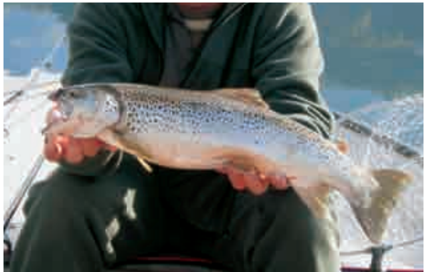
■ Bell'esemplare di trota del nostro lago.

In merito alle attività di promozione, valorizzazione e aggregazione sociale abbiamo pensato di organizzare, per il mese di luglio, una festa dei pescatori con offerte gastronomiche orientate ad un menù di pesce. Invitiamo sin d'ora la popolazione a partecipa-