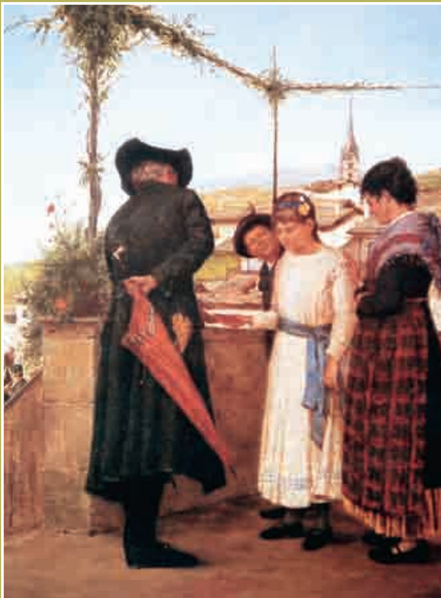
“LA CRESIMANDA” di Giulio Cesare Prati, 1885 – olio su tela, cm 71x101 Proprietà Comune di Caldonazzo (presso Biblioteca di Caldonazzo)

“Caldonazzo e il Lago nella pittura di Eugenio, Giulio Cesare e Romualdo Prati”