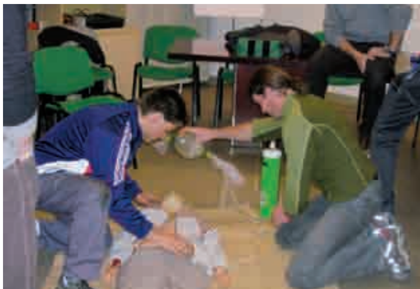
■ Prove di BLS (Basic Life Support)

sa di positivo per il proprio paese e per la propria comunità. Non resta che augurare una buona estate ed un arrivederci alla FESTA DI S. SISTO.