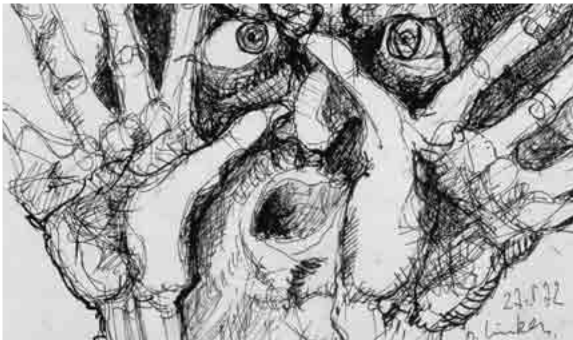
■ Riproduzione disegno di Winkler proposto sull'invito della mostra dedicata all'autore.